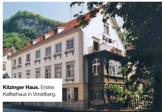
Kitzinger Haus. Erstes Kaffeehaus in Vorarlberg.