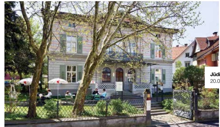
Jüdisches Museum. 20.000 Besucher pro Jahr.