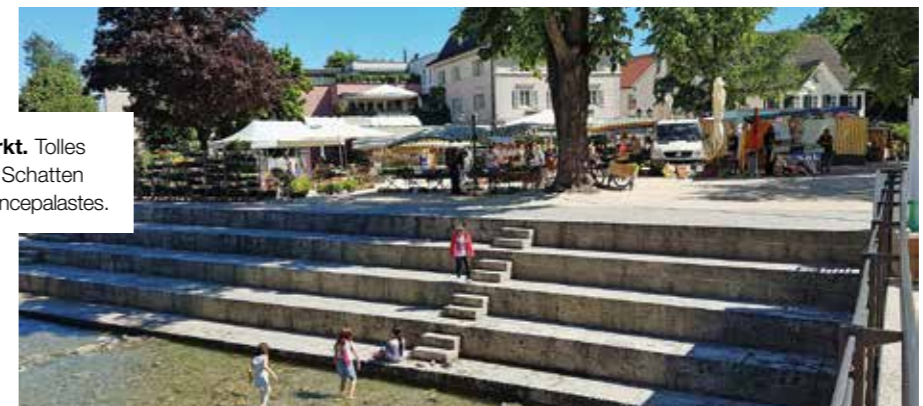
Wochenmarkt. Tolles Ambiente im Schatten des Renaissancepalastes.

Hohenems – ausgerechnet Vorarlbergs jüngste Stadt – lag Jahrzehnte im Dornröschenschlaf. Dank engagierter Personen und eines genau geplanten Entwicklungskonzeptes wurde sie wachgeküsst. Und nicht nur das: „Die kleinste Weltstadt“, wie sie Bürgermeister Dieter Egger liebevoll nennt, erfand sich neu. Mit der Konsequenz, dass das Leben in einer der schönsten Innenstädte wieder richtig zu pulsieren beginnt.