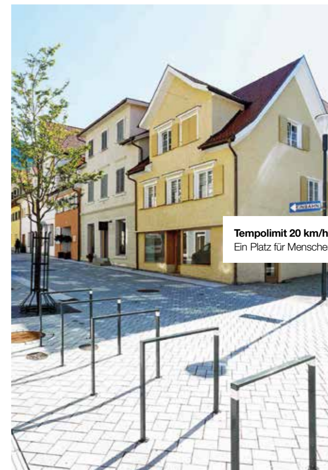
Tempolimit 20 km/h. Ein Platz für Menschen.