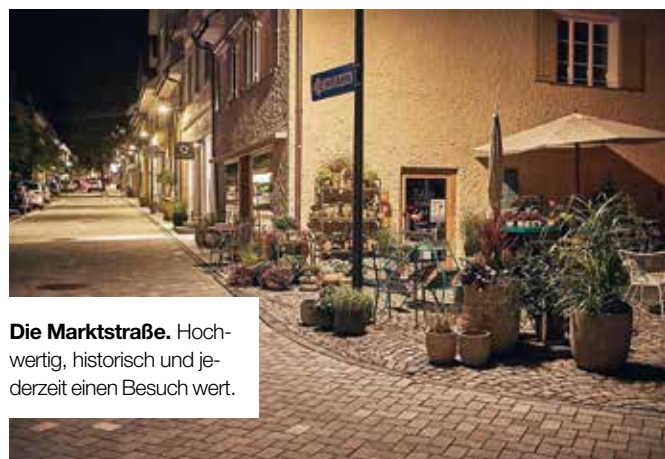
Die Marktstraße. Hochwertig, historisch und jederzeit einen Besuch wert.